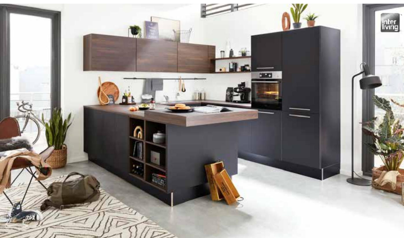
Interliving-Küchen begeistern mit einer unvergleichlichen Liebe zum Detail

„Schaffen Sie sich mit Interliving-Küchen ein Unikat, das niemand sonst zuhause hat.“