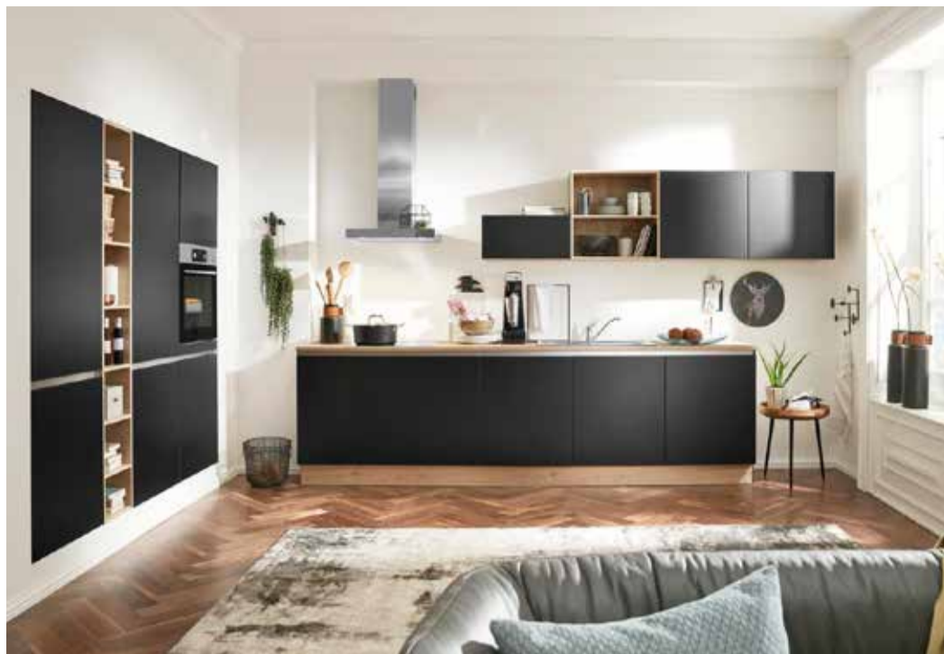
Das Küchen Center Lehrte hat eine tolle Auswahl an Wohn- und Wohlfühlküchen.

Die Lehrter Küchenprofis haben einen neuen Verkaufsleiter an Bord geholt und für ihn steht ganz der Kunde im Fokus. Wir haben ihn zum Interview getroffen, in dem er uns erzählt hat, wie er den soliden Service des Küchen Centers Lehrte für die Kunden noch attraktiver machen möchte.