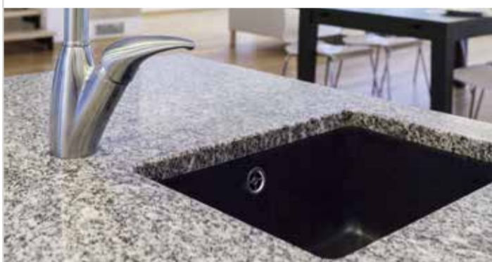
Preiswerter Luxus für Ihre Küche

Seit Jahren ist Granit der Werkstoff bei der Küchengestaltung, der das gewisse Etwas verleiht und noch dazu große Langlebigkeit und Zeitlosigkeit ausstrahlt. Wer kennt sie nicht, die Situationen, in denen man den überkochenden Topf vom Herd zieht und nicht weiß wohin damit im ersten Moment? Das ist bei einer Granitarbeitsplatte aus solidem Naturstein ganz egal. Denn Gra-